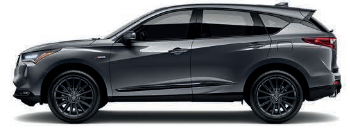
Exterior: Grafito Interior: Negro