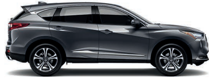
Exterior: Grafito Interior: Negro