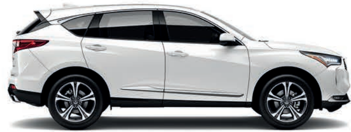
Exterior: Blanco Platino Interior: Mocha