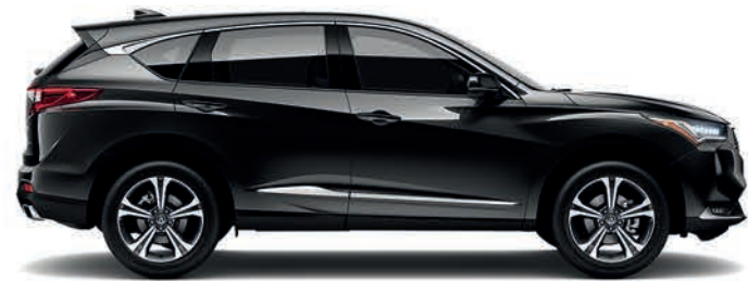
Exterior: Negro Supremo Interior: Mocha