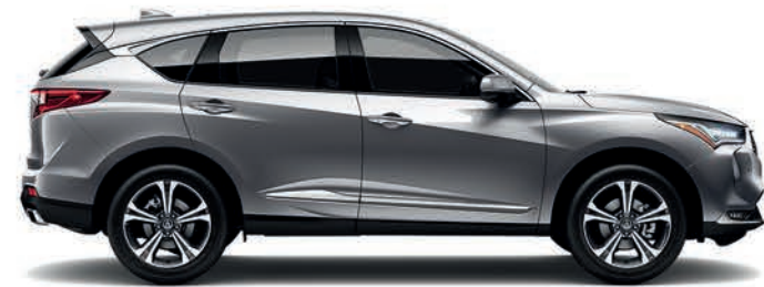
Exterior: Plata Lunar Interior: Mocha