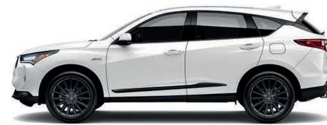
Exterior: Blanco Platino Interior: Rojo con negro