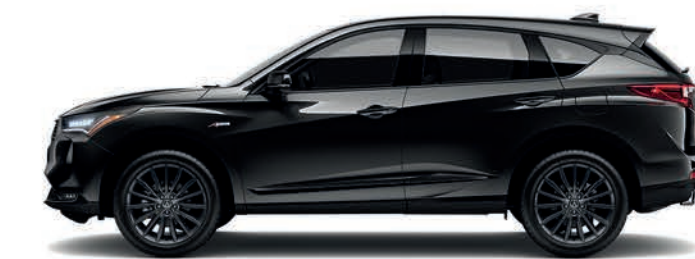
Exterior: Negro Supremo Interior: Negro