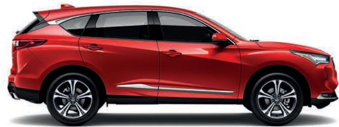
Exterior: Rojo Interior: Marfil

Los colores varían según el color y la versión elegida. Consulta disponibilidad con tu Distribuidor Acura.